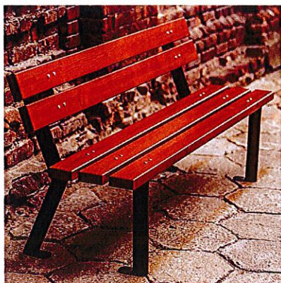
Fot.1. Poglądowe zdjęcie ławki