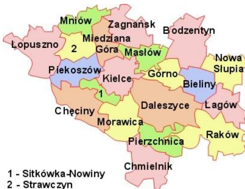
Rysunek 1. Miedziana Góra na tle powiatu kieleckiego

Gmina Miedziana Góra położona jest w województwie świętokrzyskim, w powiecie kieleckim. Oddalona jest od Kielc o około 12 km i od Skarżyska-Kamiennego o około 38 km, dlatego też pozostaje w obszarze bezpośrednich wpływów obu miast (społecznych, ekonomicznych, rekreacyjnych i infrastrukturalnych). W skład gminy wchodzi 10 sołectw, zaś terytorium gminy i miast obejmuje obszar 71 km 2 .