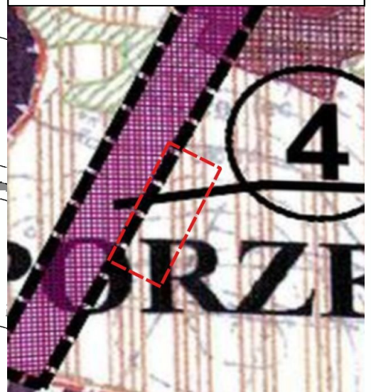
Wrys ze studium uwarunkowań i kierunków zagospodarowania przestrzennego gminy Miedziana Góra

droga gminna DROGA GMINNA PRZEBIEGAJĄCA POZA GRANICAMI PLANU